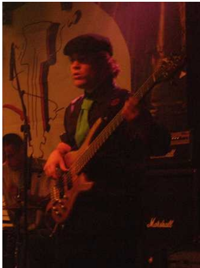
...Maar vooral onze eigen bassist Truly Yours blonk uit!