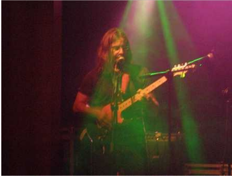
Meneer de Nutking was “nogal gecharmeerd” van Inshore