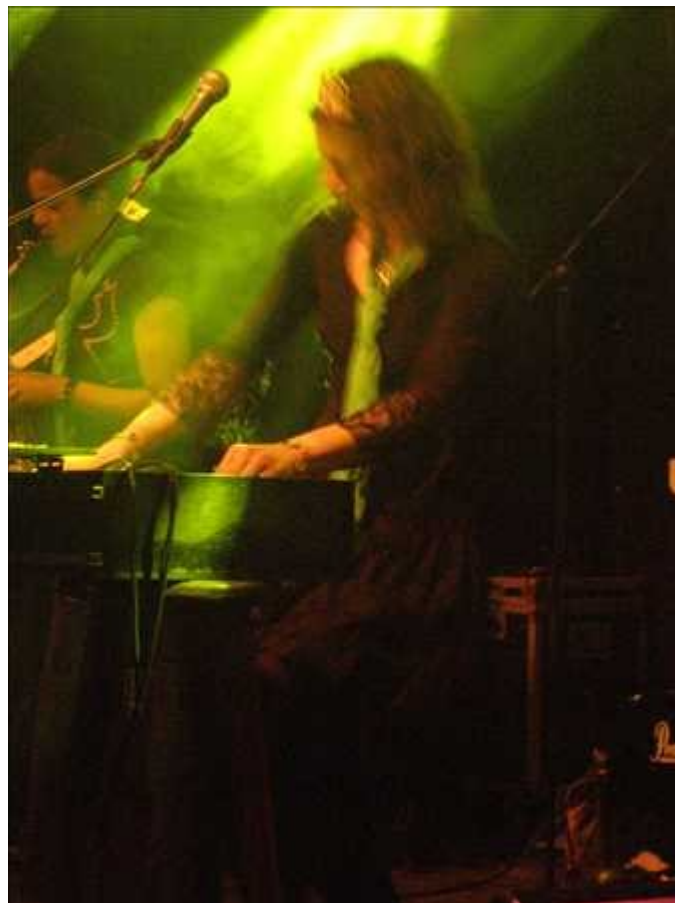
Deeky en Les soleren in Funk Meets Acid